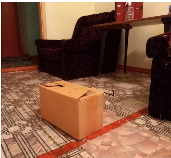
Обнаружение подозрительного предмета в здании ДОУ