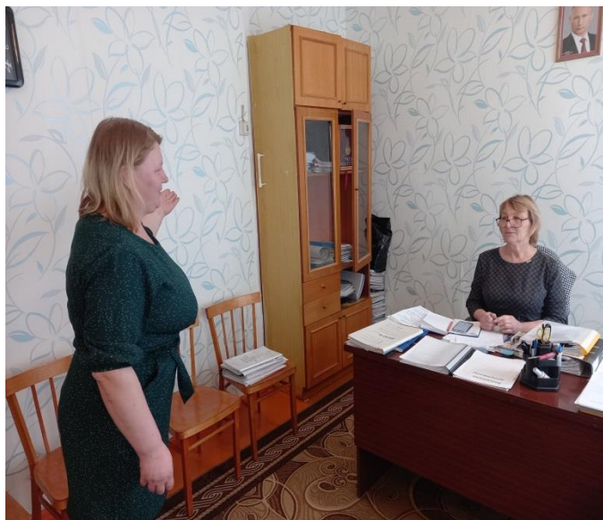
Доведение информации до администрации ДОУ