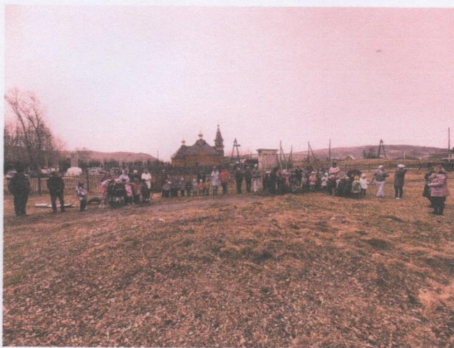
Сверка списочного состава детей и сотрудников

Заведующий МБДОУ Детский сад «Подснежник»