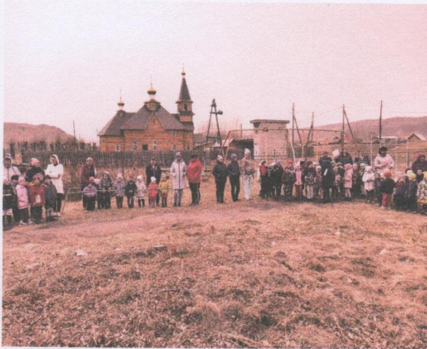
Организация места сбора (организован сбор в безопасном месте)