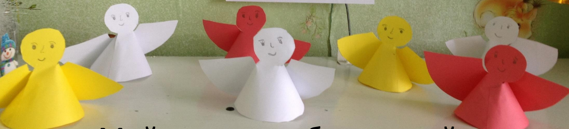
«Мой ангел» - работы детей