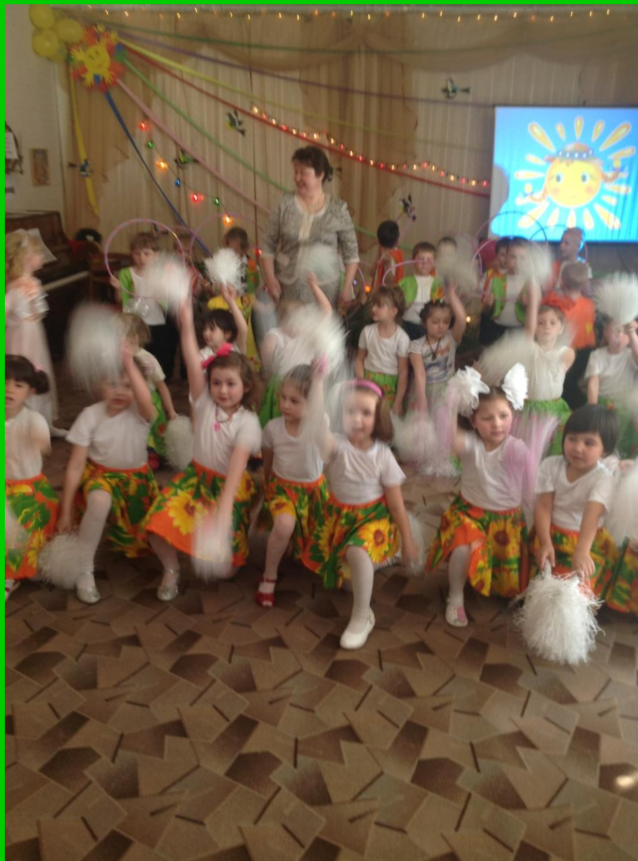
Заключительная композиция «Светит солнышко для всех»