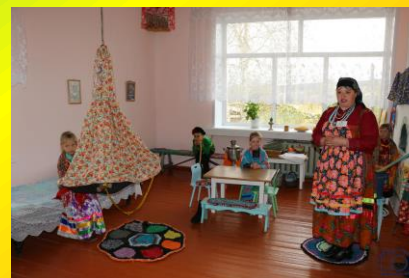
Вовлечение в общую работу