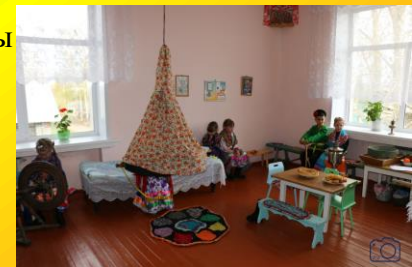
Создание творческой обстановки