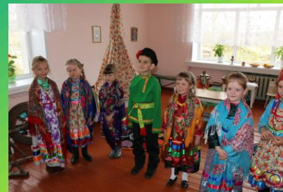
Организация командной работы