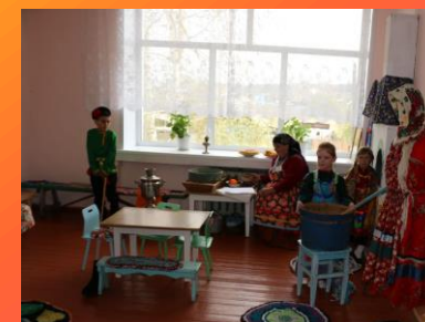
Придание личной значимости