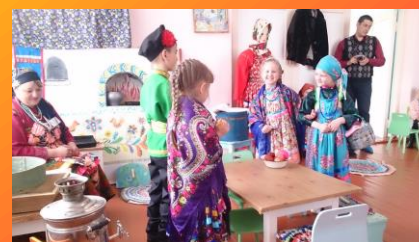
Понимание и мотивация