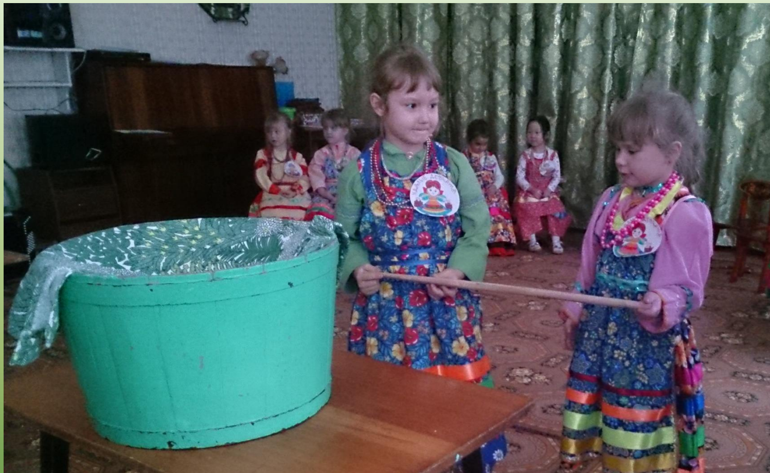
Русская народная песня «Квашня»