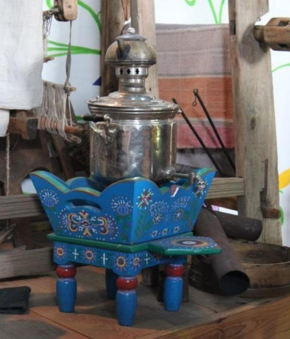
Самовар на подсамоварнике, расписанном семейской домой росписью.

Хозяйка все время присматривала как горят в топке угли тлеют ли они горят ли сильно разгораются хорошо или еле-еле. С самоваром связано множество примет: