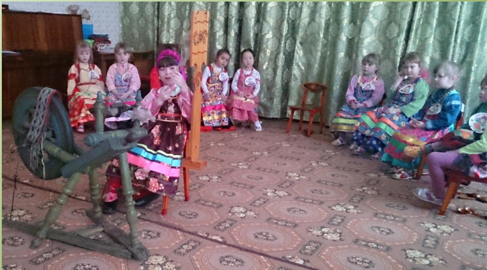
Русская народная песня «Прялица»